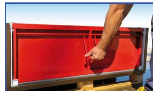
3) Abbassare la leva azionatrice.