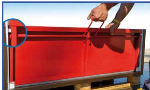
2) Portare la paratia in posizione verticale ancorando i rulli alla guida fissa.