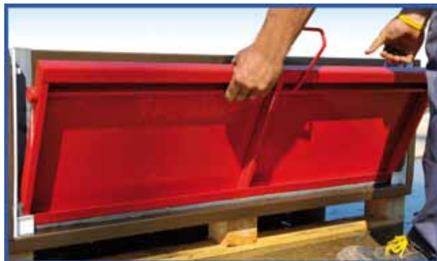
1) Inserire la paratia nelle guide fisse.

Montare le paratie è un'operazione semplice e veloce che si può fare in sole 3 mosse .